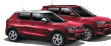
Cherry Red (RAV)* 1