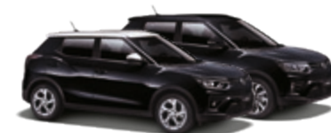
Space Black (LAK)* 1