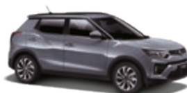
Platinum Gray (ADA)*