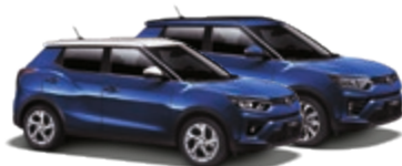
Dandy Blue (BAS)* 1