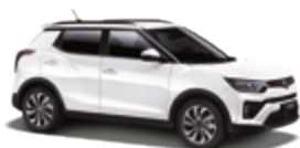
Grand White (WAA)